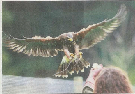
Les rapaces sont envoyés aux quatre coins du canton pour répondre aux demandes des communes, des agriculteurs et des entreprises.