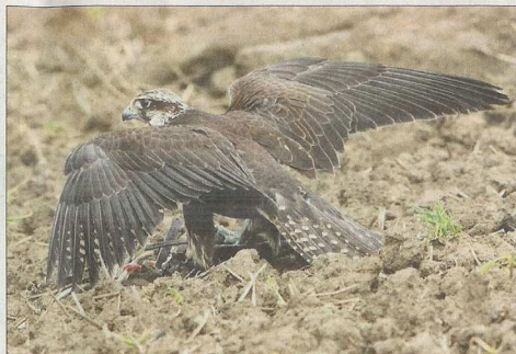
Le faucon sacre est utilisé surtout dans un milieu rural. En ville, son important rayon de vol l'exposerait à de nombreux risques mortels.